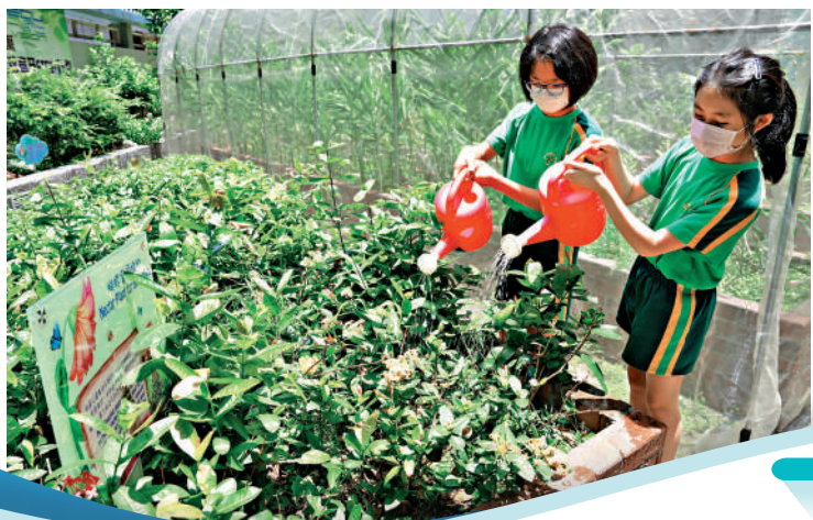
◀學生在生境園為植物澆水，身體力行參與栽種。