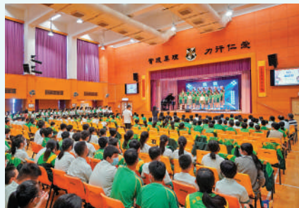
▲教育佳記者採訪當日，學校舉行歌唱比賽，同學努力獻技，爭取佳績。

心教育和輔導，才能真正展現到才華。「我覺得孩子不是所謂的『贏在起跑線』，而是贏在愛之中。」