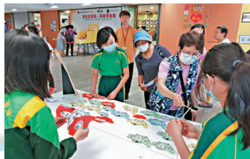
▲學生參加義工計劃，走進社區與老人家玩遊戲。

「雖然聽上去中草藥對小學生是一個很遙遠的話題，但實際上一些中草藥在日常生活中也很常見，只是小朋友不知道而已。」