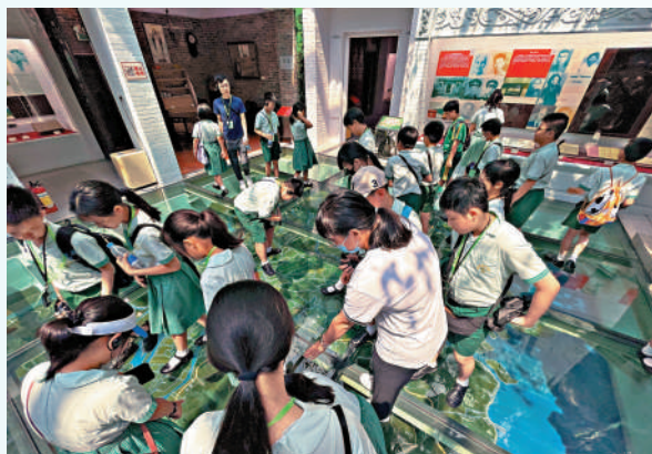
◀學生們早前到訪中山市一間學校，參與交流活動，大開眼界。